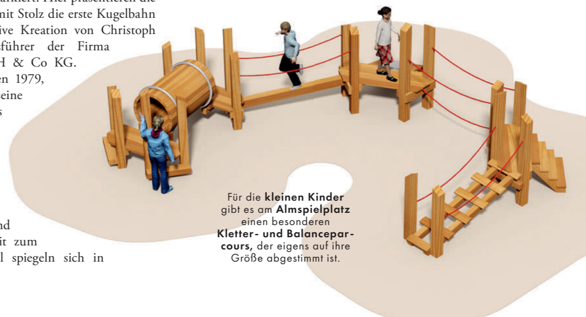
Für die kleinen Kinder gibt es am Almspielplatz einen besonderen Kletter- und Balanceparcours, der eigens auf ihre Größe abgestimmt ist.

Der Almspielplatz entfaltet für die kleinen Abenteuer*innen eine faszinierende Welt. Anmutige hölzerne Torbögen fügen sich harmonisch in das Gesamtkonzept des Katschbergs ein, während eine abenteuerliche Hang-Röhrenrutsche eine spannende Verbindung zwischen der Kugelbahn und dem Almspielplatz schafft. Eine charmante hölzerne Schutzhütte, ausgestattet mit Sanitäreinrichtungen und Erfrischungsautomaten, lädt zu einer Pause ein und dazu, die idyllische Umgebung zu genießen. Ein vergnügliches Sand-Wasserspiel mit archimedischer Spirale, Wasserrädern und einem abgegrenzten Sandbereich sorgt für Freude und Abkühlung. Ein Gurtsteg, der wie ein Trampolin reagiert, eine Doppelseilbahn und ein Karussell in Katschi-Blau setzen zusätzliche Glanzlichter auf dem Spielplatz. Der Kleinkindparcours eröffnet den jüngsten Besucher*innen vielfältige Möglichkeiten zum Klettern, Balancieren und Durchqueren. Schaukeln in verschiedenen Ausführungen, Wippen in Form einer fröhlichen Schafherde, die sogar lustig blöken kann, und eine Doppelwippe für bis zu vier Kinder bieten unzählige Spielooptionen.